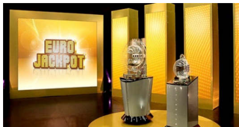
Abb.: Die EuroJackpot-Ziehung in Helsinki

Wenn die Garantieverhältnisse von Systemen berechnet werden, entstehen oft hunderte und manchmal tausende von verschiedenen Trefferfällen. Die alle zu publizieren wäre total unübersichtlich. In diesem Buch wurden deshalb die Gewinnfälle nach einem strengen Prinzip zusammengefasst, ohne jedoch die Aussagekraft zu schmälern. So werden bei jeder Anzahl richtiger Gewinnzahlen die dabei vorkommenden Trefferfälle aufgrund des jeweiligen höchsten Rangtreffers zu einem Trefferfall komprimiert. Für jeden Trefferfall wird selbstverständlich ausgewiesen, wie hoch die prozentuale Chance ist. Trotz dieser kompakten Darstellung wird pro System eine ganze Buchseite benötigt. Die Gewinnfälle sind zudem unterteilt in Bezug auf richtige Stern- bzw. Eurozahlen.